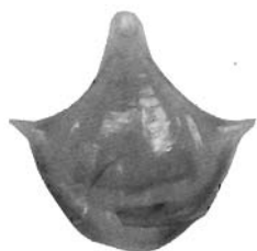
— 5 —

台灣海域駝螺螺應在十種以上，希望貝友多努力，如有採集到其他品種，在貝友上發表，為中華民國貝類學會盡一分責任。