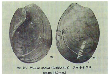
圖二 . Philine otukai Habe, 1949原圖