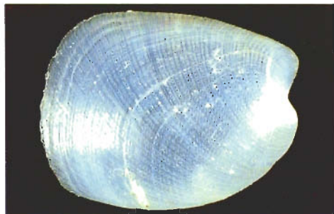
圖六 . Philine argentata Gould, 1859 殼面微細彫刻