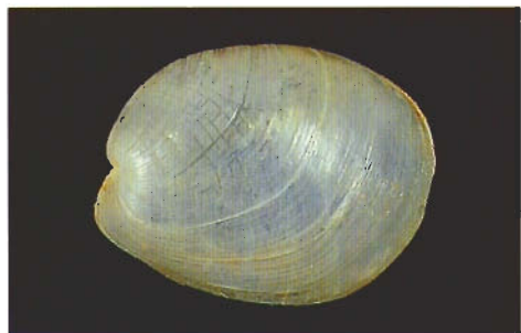
圖三 . Philine otukai Habe, 1949 澎湖產