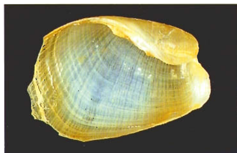
圖七 . Philine vitrea Gould, 1859 台灣東北部外海