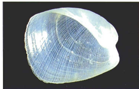
圖五 . Philine argentata Gould, 1859 台灣東北部外海