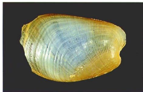
圖八 . Philine vitrea Gould, 1859 殼面微細彫刻