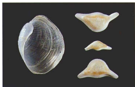
圖四 . Philine otukai Habe, 1949 及三塊胃板，大溪漁港